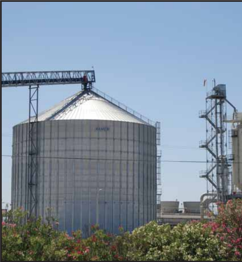
Proteja su inversión con silos SCAFCO.