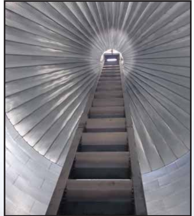
Las escaleras de caída lenta reducen la tensión creada por el flujo de materiales y ayuda a prevenir pérdidas por rotura del producto.