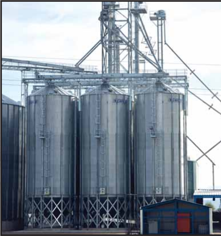
Los silos de fondo cónico de SCAFCO son disponibles en capacidades de hasta 1,500 toneladas.