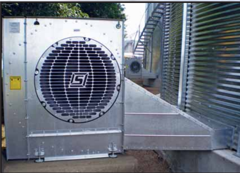
Ventiladores centrífugos proporcionan un gran caudal de aire.