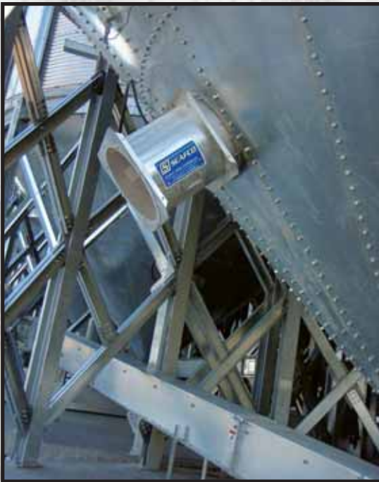
Los ventiladores axiales SCAFCO proporcionan un mayor caudal de aire.