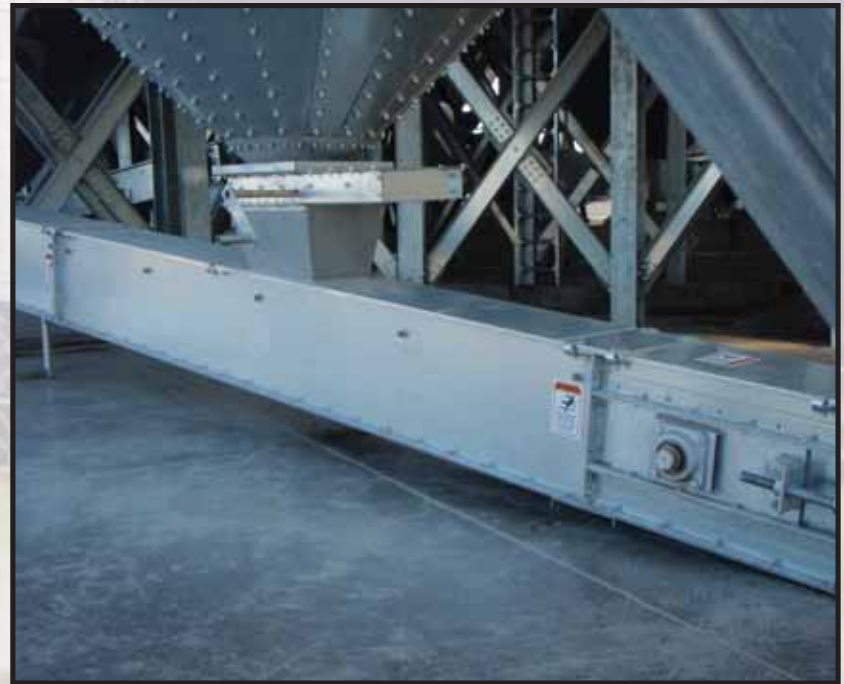
Los silos de fondo cónico son fáciles de limpiar.