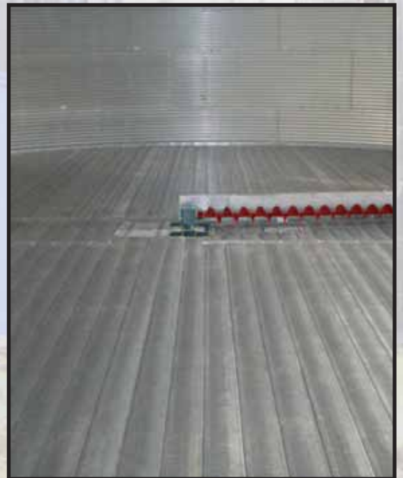
Los pisos de placa perforada permite el secado o que el aire acondicionado sea distribuido uniformemente a través de los granos.